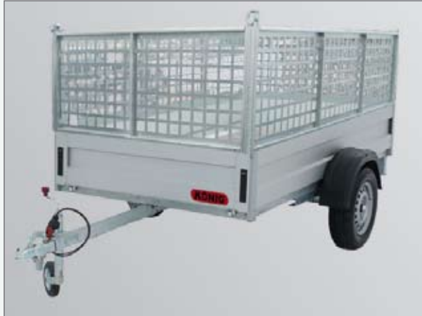
Optional: Stahlgitteraufsatz abnehmbar - Tieflader