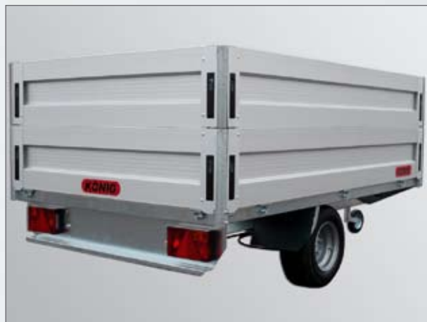
Optional: Bordwandaufsatz - Hochlader