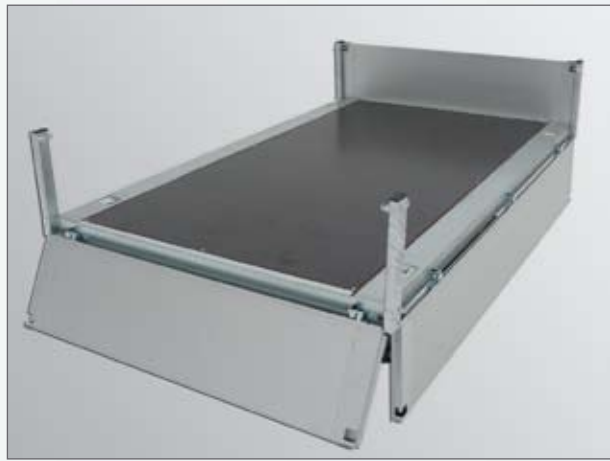
Serie: Bordwände allseitig abnehmbar - Hochlader