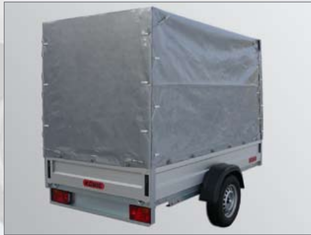
Optional: Plane/Gestell in verschiedenen Höhen erhältlich