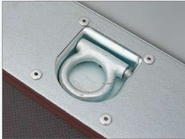
Serie: Verzurrösen im Rahmen integriert - Hochlader