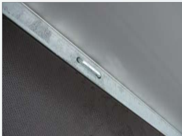
Serie: Verzurrösen im Rahmen integriert - Tieflader