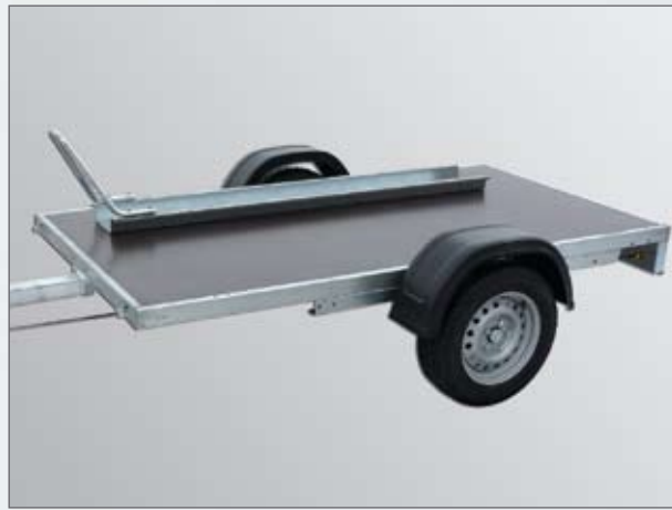
Serie: Bordwände allseitig abnehmbar - Tieflader Optional: Motorradstandschiene